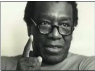
Milton Santos ( 1926–2001) Geógrafo brasileiro

«A paisagem artificial é a paisagem transformada pelo homem. Se no passado havia a paisagem natural, hoje essa modalidade de paisagem praticamente não existe mais (...). Quanto mais complexa for a vida social, tanto nos afastamos de um modo natural e nos endereçamos a um mundo artificial(...), este parece ser o caminho da evolução.»